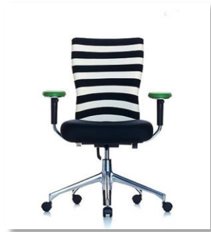
Beispiel Vitra T-Chair