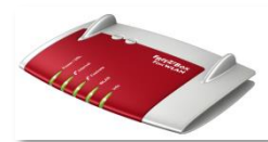
Beispiel AVM Fritzbox Router

Telefondaten und Datentransfers sind nicht in Tagespauschalen enthalten und von Dir als Auftraggeber gesondert zu buchen und zu vergüten.