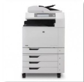
Beispiel Netzwerk Drucker/Scanner

Sind grössere Formate erforderlich, werden externe Dienstleister oder interne Plotter oder Digitalprinter benötigt.